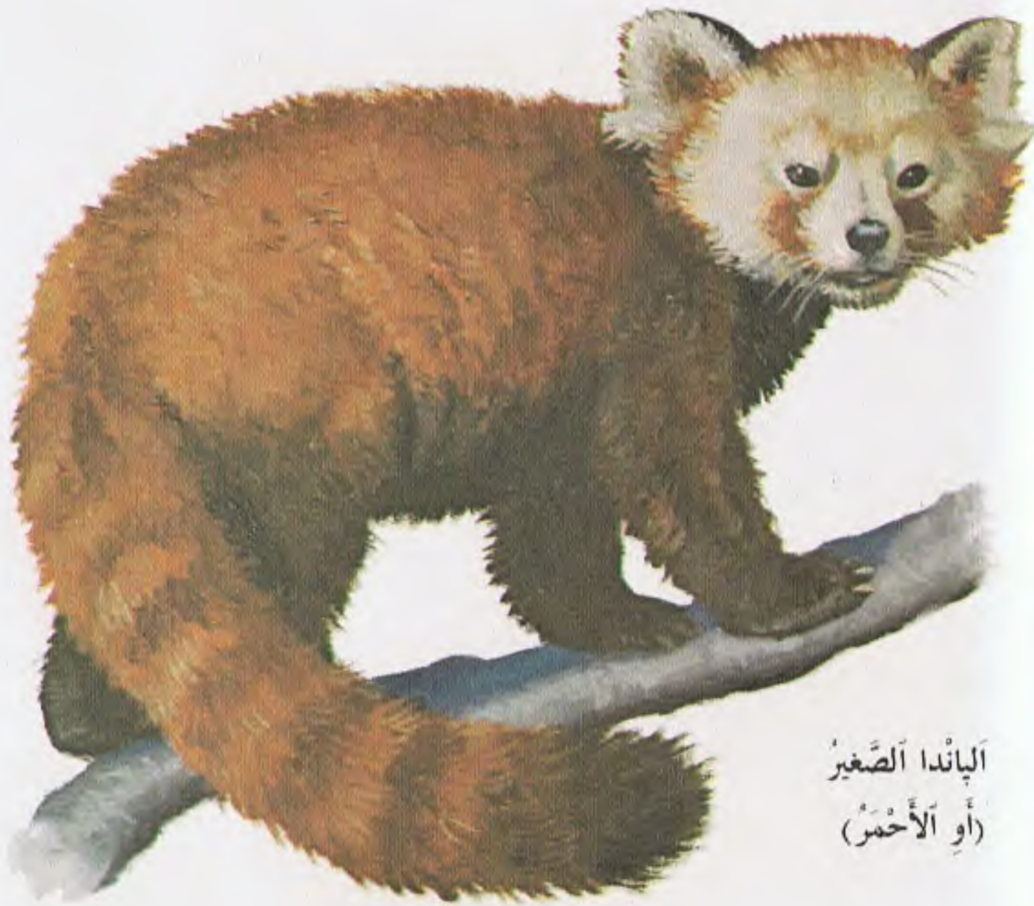
الپاندا الصَّغِيرُ (أَوْ الْأَحْمَرُ)

يُصَنَّفُ عُلَمَاءُ الْحَيَوَانِ الْپَانْدَا ، غَالِبًا ، مَعَ الرَّاكونِيَّاتِ . لَكِنْ هُنَالِكَ فُرُوقٌ كَبِيرَةٌ بَيْنَ الْپَانْدَا وَالرَّاكونِ .